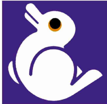
Abb. 2 – Zweideutiger Stimulus: Hase oder Ente?

Abbildung 1 zeigt ein solches zweideutiges Bild. Wird es von oben nach unten gelesen – und etwa die beiden Buchstaben rechts und links verdeckt, sehen wir klar eine „13“. Von links nach rechts lesend rekonstruieren wir aus den Zeichen ein „B“. In Abbildung 2 können wir eine Ente oder einen Hasen entdecken, je nachdem, worauf wir unser Augenmerk richten. Spätestens seit der Erforschung solcher visuell zweideutiger Stimuli wissen wir, dass unsere Wahrnehmung, und damit auch unsere gesamte Erfahrung, extrem kontextsensitiv ist. Der Kontext hilft uns, die Zweideutigkeiten aufzulösen, die in einem visuellen (und eigentlich in fast jedem) Stimulus enthalten sind (Gheorghiu & Kruse, 1991). Der erweiterte Kontext ist unser kulturell-sprachlicher Kontext. Ihn ziehen wir zu Rate, wenn wir eine Erfahrung nicht einordnen können. Wir greifen auf dort verfügbare Begriffe und Termini zurück, mit denen wir unsere Erfahrung ordnen und Sinn stiften. Je neuer und unverständlicher uns eine Erfahrung vorkommt, desto grö-