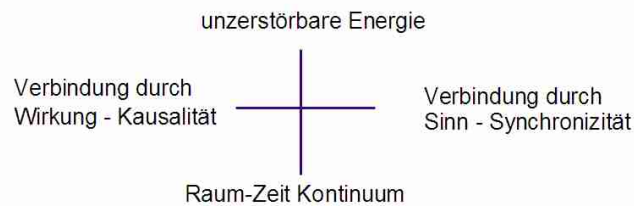
Abb. 4 – Quaternion mit Synchronizität als komplementäres Element zur Kausalität

In dieser Quaternion stellt sich unsere Welt, das Raumzeitkontinuum, als konkret gewordene Ausgestaltung der unzerstörbaren Energie dar. Die Verbindung von Ereignissen durch Kausalität, unser gewohntes Verständnis der materiellen Welt, wird ergänzt durch eine andere Art von Verbindung, der Verbindung durch Sinn, oder Synchronizität, in der es eine Korrespondenz zwischen materiellen und psychischen Ereignissen gibt. Pauli hat sich diese Vorstellung zumindest in seinen unpublizierten Schriften und im nicht-öffentlichen Bereich zu eigen gemacht, sich jedoch publizierend nur vorsichtig geäußert.